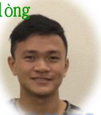
軌道部スオンです。