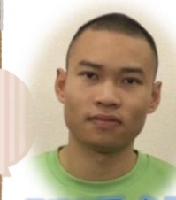
軌道部ティンです。