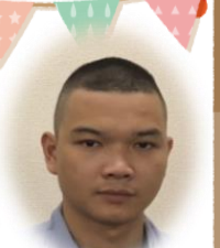
軌道部クアンです。